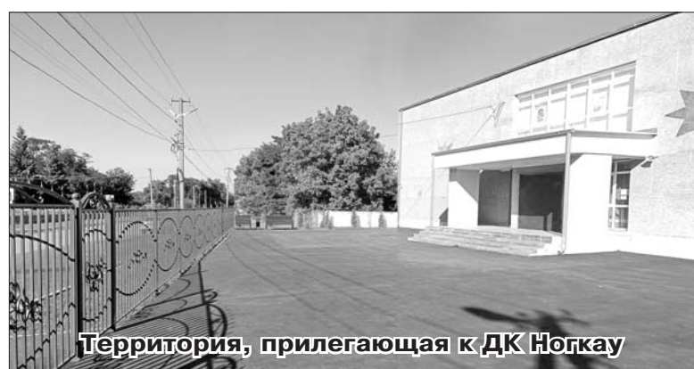
Территория, прилегающая к ДК Ногкау