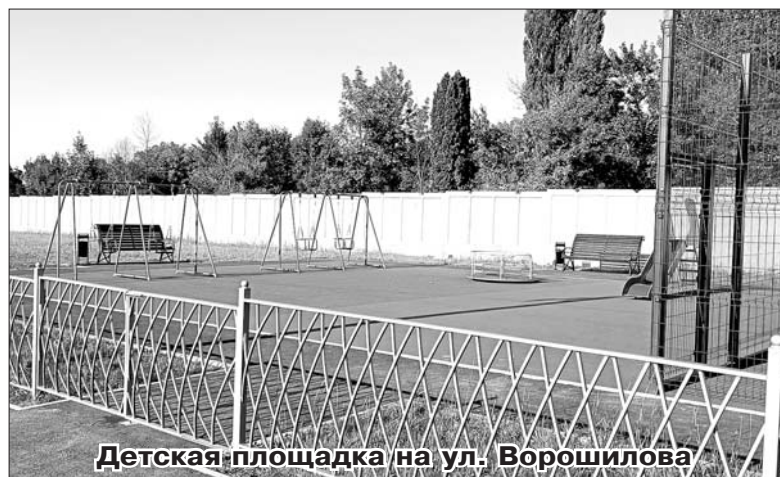
Детская площадка на ул. Ворошилова

лись детская площадка с игровым оборудованием и площадка для спортивных игр с баскетбольной стойкой и кольцом. Площадки ограждены металлическими панелями, покрыты асфальтобетоном,